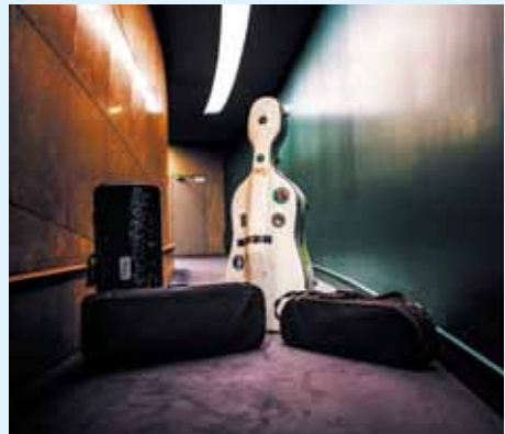
Quatuor à cordes. Coulisses. Salle des concerts.